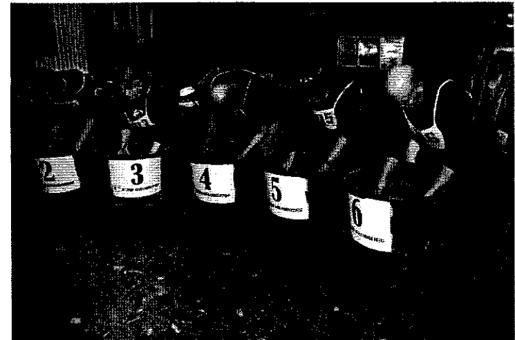
Zetorin kullanhuuhtojat järjestää

Koska kiekerötilaa on rajallisesti pyydetään mukaan aikovia ilmoittautumaan ke 2. maaliskuuta mennessä kasöörille puh. 0400 323433. Ilmoittautumisen yhteydessä tulee ilmoittaa mahdollinen halunsa käyttää järjestettyä yhteiskuljetusta.